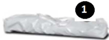
1. Bolsa de transporte