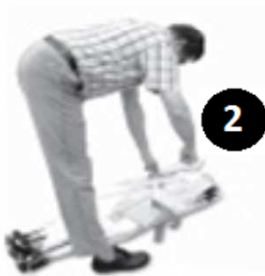
2. Sacar la pantalla de seguridad de la bolsa . No es necesario para montar la pantalla de seguridad en el lugar exacto, porque se puede, incluso cuando esta montada, fácilmente ser llevada a la ubicación deseada.