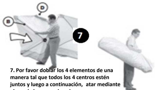
7. Por favor doblar los 4 elementos de una manera tal que todos los 4 centros estén juntos y luego a continuación, atar mediante el uso de la correa de nylon