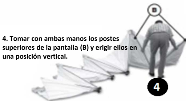
4. Tomar con ambas manos los postes superiores de la pantalla (B) y erigir ellos en una posición vertical.